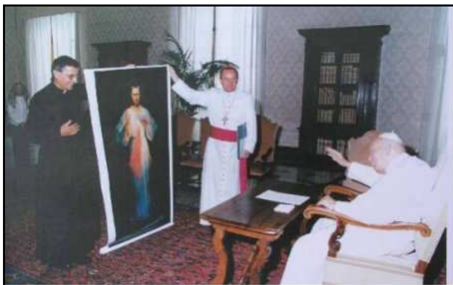
Bénédiction du Image du Christ Miséricordieux par le Saint Père Jean Paul II pour le Sanctuaire d'Atok