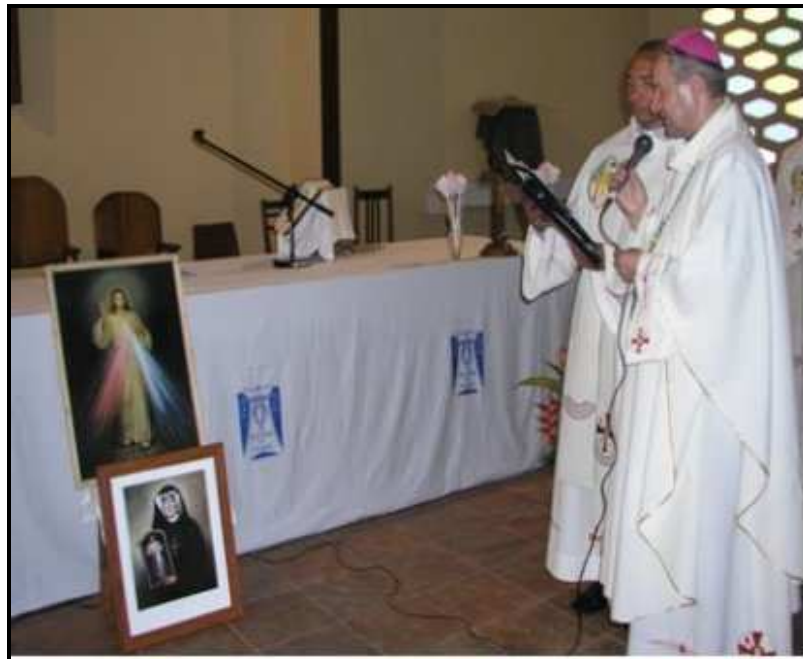
Consécration au Christ Miséricordieux de la paroisse SS Pierre et Paul a Abong Mbang.

L'outil c'est notre culte, et surtout notre consécration a Lui.