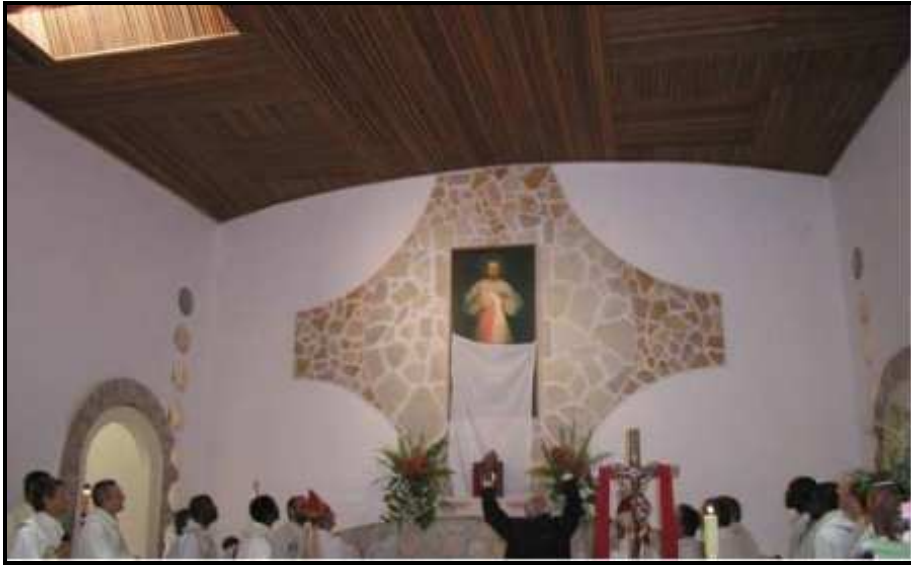
Intronisation du Image du Christ Miséricordieux le Dimanche de Miséricorde le 18.04.2004