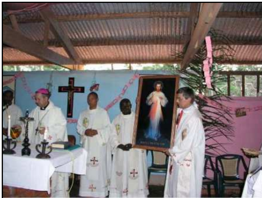
Evangélisation dans une nouvelle paroisse de Mesok