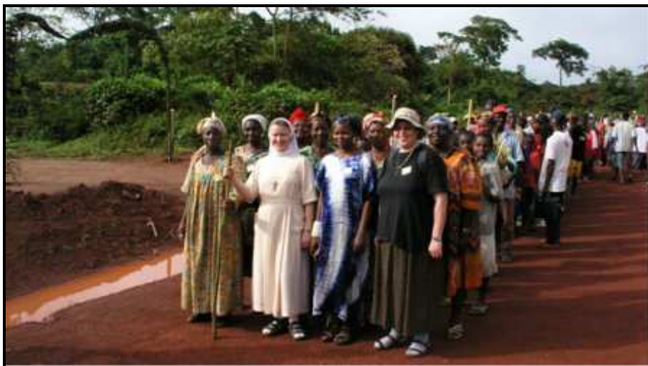
Pèlerinage au Sanctuaire d'Atok en 2005