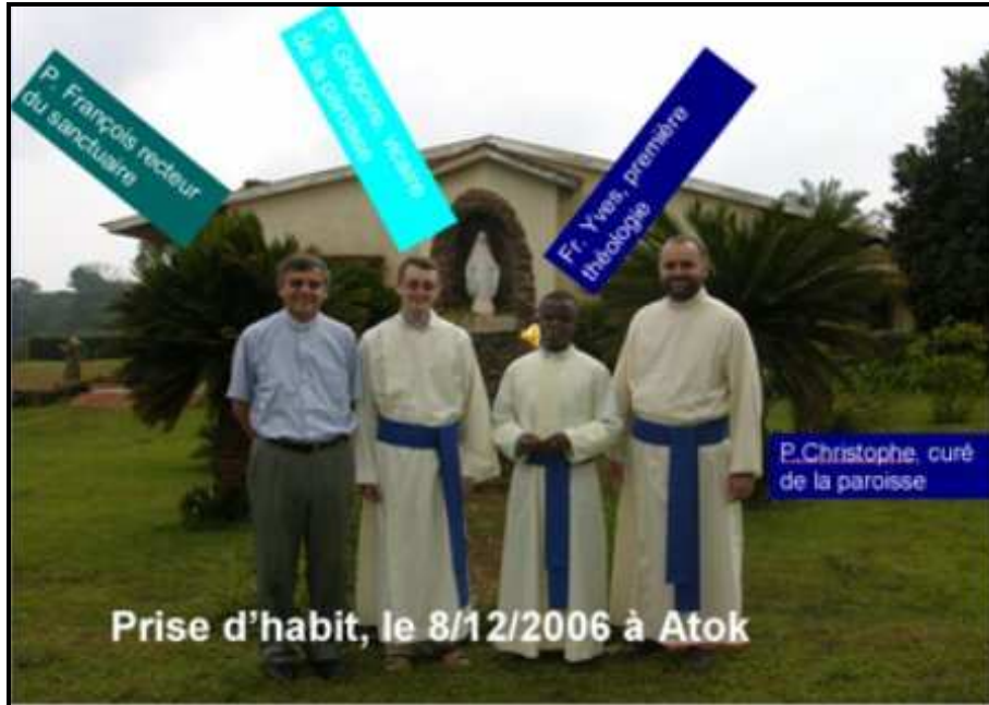
Les Pères et Frères Mariens qui travaillent au Sanctuaire d'Atok

« Dis que je suis l'amour et la miséricorde même » PJ 1074 « Le ciel et la terre retourneraient plus vite au néant avant qu'une âme confiante échappe à ma miséricorde » PJ 1777