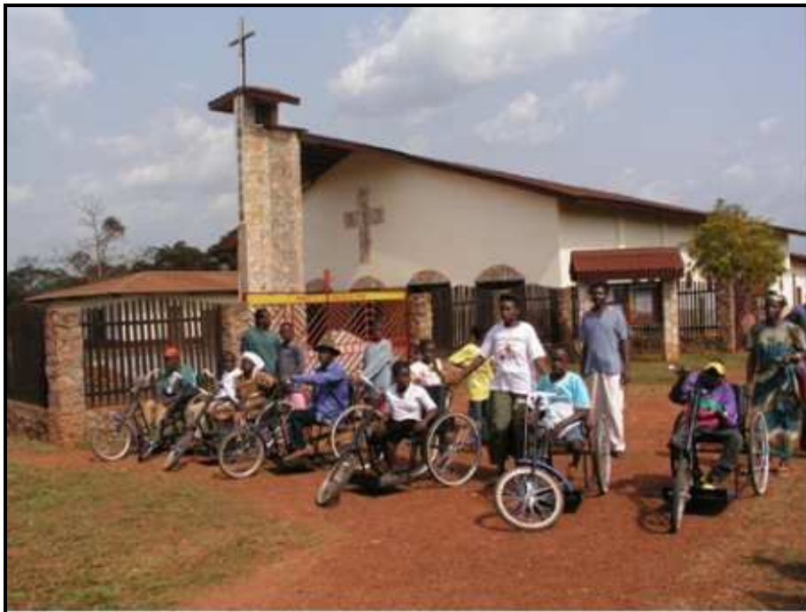
Action charitable pour les handicapés de la paroisse

Deux fois de suite, nous avons organisé la pastorale de proximité en visitant chaque famille. Cela nous a permis de connaître mieux leur vie et leur situation. Après les visites des maisons, nous avons créé une équipe avec les Sœurs des Anges et nous avons visité les personnes abandonnées, oubliées, laissées à la merci de quelqu'un et certaines sans aucun espoir. Dans toute la paroisse il y avait 118 personnes montrées par nos catéchistes. Nous les avons tous rencontrés en faisant un discernement dans le but de les aider efficacement. Dans le rapport final nous lisons certains chiffres : Aide Spirituelle et les sacrements des malades aux personnes . Les vélos triporteurs pour 11 handicapés. Aide urgente dans le dispensaire des Sœurs des Anges à 30 personnes. Aide clinique à Yaoundé à 4 personnes, réhabilitation dans le Centre orthopédique à 2 personnes, formation dans les écoles spécialisées à 4 personnes etc. Nous avons déjà résolu plusieurs cas, les autres attendant le moment favorable.