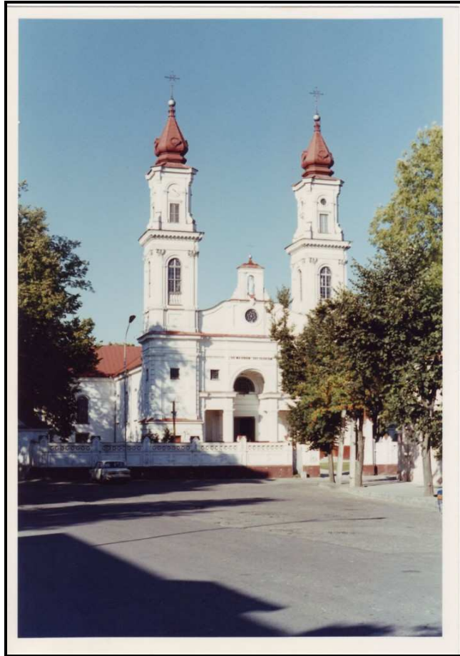
L'Eglise des Mariens à Mariampol; Dans l'ombre de cette Eglise grandi dans sa jeunesse Georges Matulewicz , Native près de cette paroisse à Lugine Il était formé par les Mariens qui ont travaille à Mariampol.