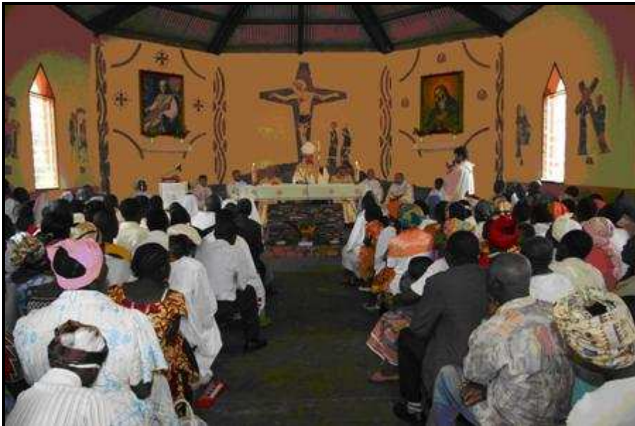
La chapelle de Kodjans, dédiée au Bienheureux Georges Matulewicz