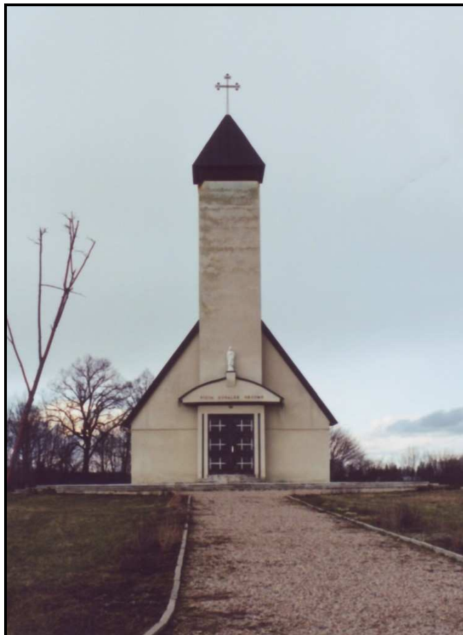
La chapelle du Bienheureux Georges Matulewicz a Lugine en Lituanie

Georges Matulaitis naît en Lituanie en 1871. Ordonné prêtre en 1898, il est professeur au séminaire polonais de Kielce. En ce temps où la région connaît beaucoup de pauvreté, il approfondit la question sociale. Il s'intéresse aussi à la vie religieuse, redonnant vie à la Congrégation des Marianites dans laquelle il devient religieux, et fondant les Sœurs des pauvres de l'Immaculée qui deviendront le groupement de religieuses le plus important en Lituanie. Nommé évêque auxiliaire de Vilna en 1918, il doit faire face aux nombreuses factions antagonistes, notamment Lituaniens et Polonais. Homme de paix, il pourra dire : « Je suis né en Lituanie...Presque toute ma vie, j'ai travaillé en Pologne, et je l'ai fait avec loyauté et de toute ma force. » Effectivement, il va jusqu'à l'épuisement. Il donne sa démission en 1925 ; mais Pie XI qui apprécie "cet homme vraiment saint" le nomme immédiatement archevêque et Visiteur apostolique en Lituanie. Il rétablit de nouveau la paix entre Polonais et Lituaniens et prépare un Concordat entre la Lituanie et le Saint-Siège. Il meurt brusquement à 55 ans en 1927. Le Concordat sera signé peu après.